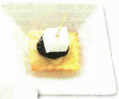
טעימות ממחלבת אדיר. ויש גם יין